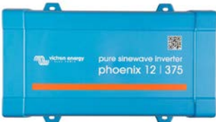
Phoenix 12/375 VE.Direct