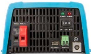
Phoenix 12/375 VE.Direct