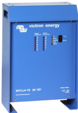
Cargador Skylla 24V 50A