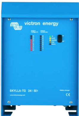
Skylla TG 24 50