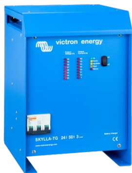
Skylla TG 24 50 3 phase

Para saberlo todo sobre las baterías, las configuraciones posibles y ejemplos de sistemas completos, pida nuestro libro gratuito "Energía Sin Límites" también disponible en www.victronenergy.com